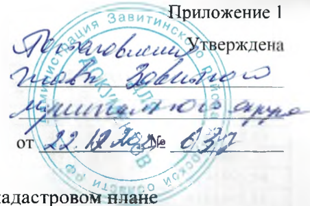
Схема расположения границ публичного сервитута на кадастровом плане